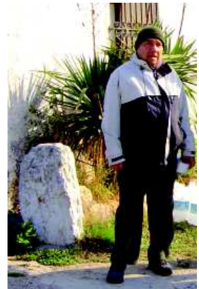
Foto: Control als 5 Cims de l'any 2005

Des d'aquestes línies, volem fer-ne memòria i expressar el nostre més sincer condol als seus familiars.