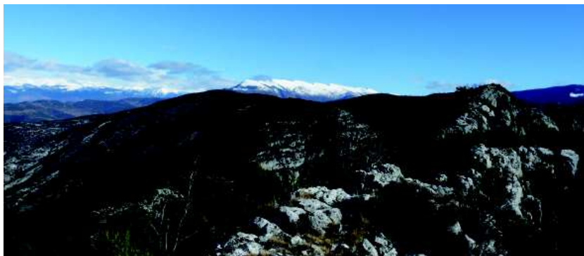
Prepirineu lleidatà, d'Alinyà a Perles, vista des del cim de Roc Galliner