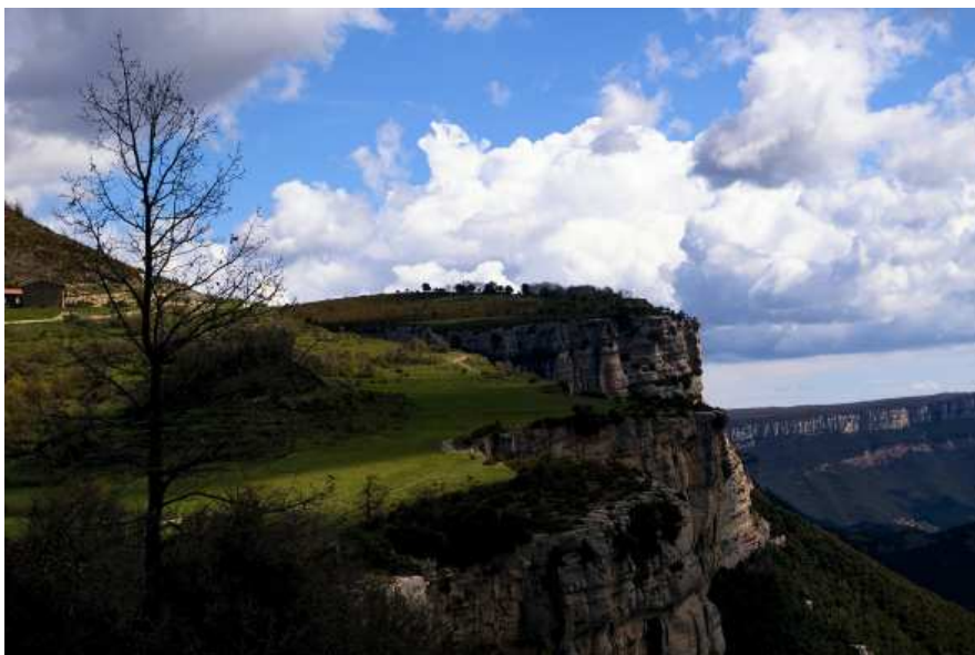
Foto guanyadora del Saló de Muntanya, de la «Votació popular» títol: De Rupit a Tavertet , de Carme Mas Puigdomènech.