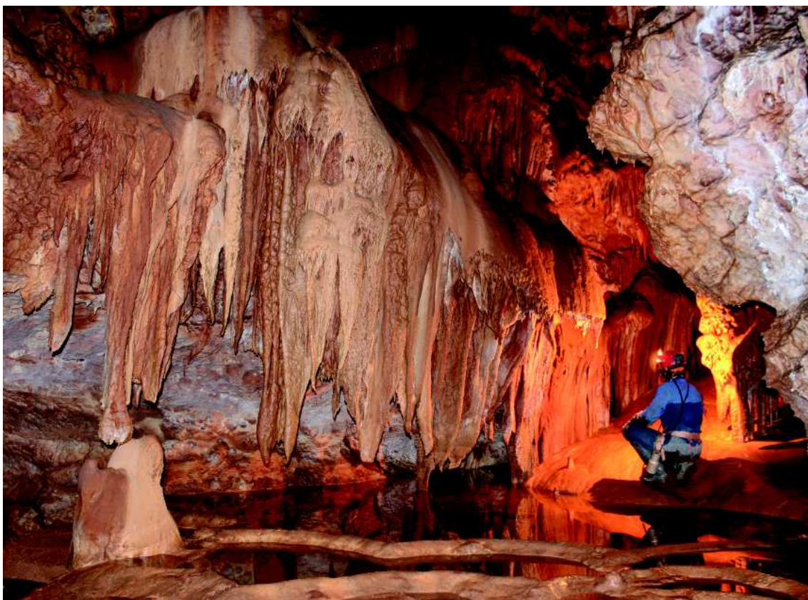
Avenc del Salany, situat a la Mola de Catí (Els Ports)