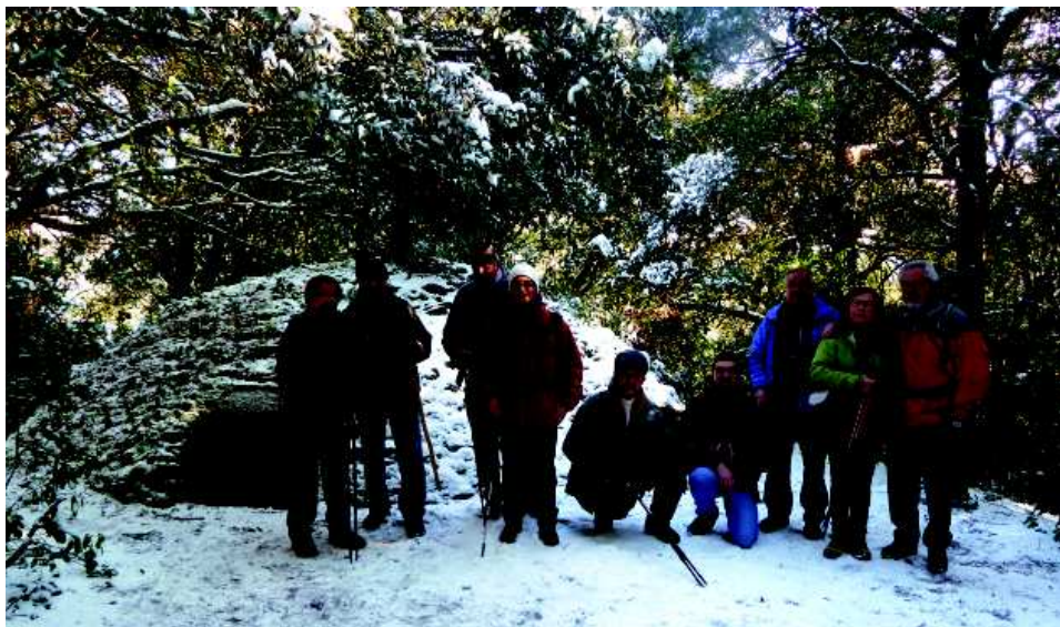
Davant del pou de glaç de la Serra de l'Obac l'endemà de la nevada del 23 de febrer