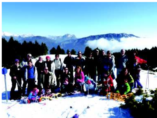
Grups Familiar i Juvenil a Tuixén-La Vansa