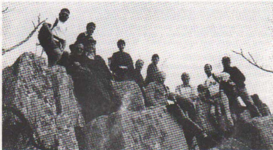
Al cim de l'esquel de Morou (Montseny).

Dia 9: Serra de l'Obac : La Barata, coll Estret, pou de Glaç, coll Estret, Paller de Tot l'Any, font del Lladre, coll de la Canal del Correu, balma de l'Espluga, coll de Tosca, font de la Pola, la Pola (924 m), coll de Tres Creus, Castellsapera (940 m), la