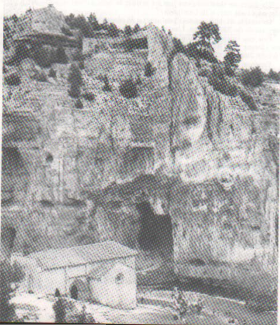
La cova Negra al Cañón de Río Lobos (Sòria).