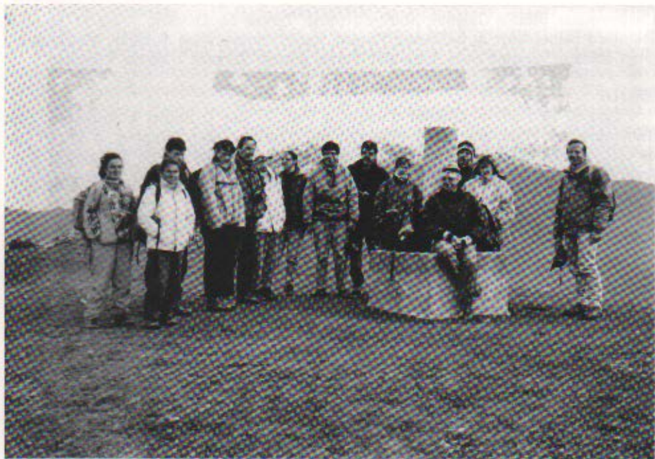
Cim del Samont (Montseny).