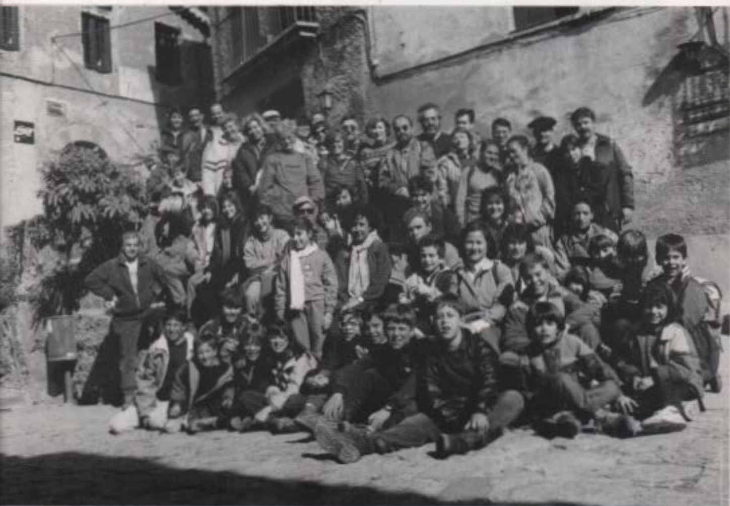
El Grup Infantil en l'excursió al puig de la Balma (Mura)