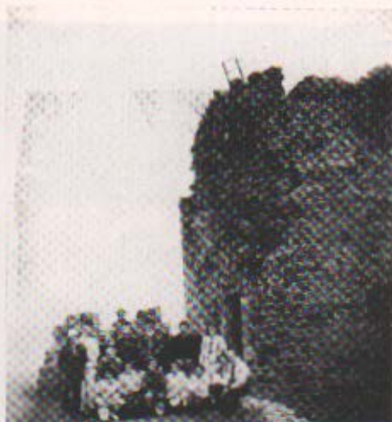
Dalt del castell de Montsoriu.