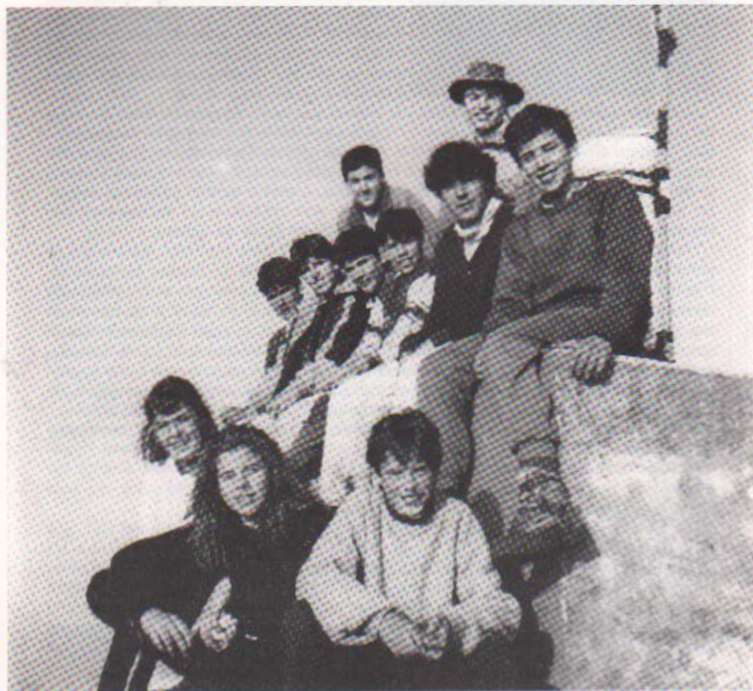
El Grup Juvenil dalt el Puigsacalm.