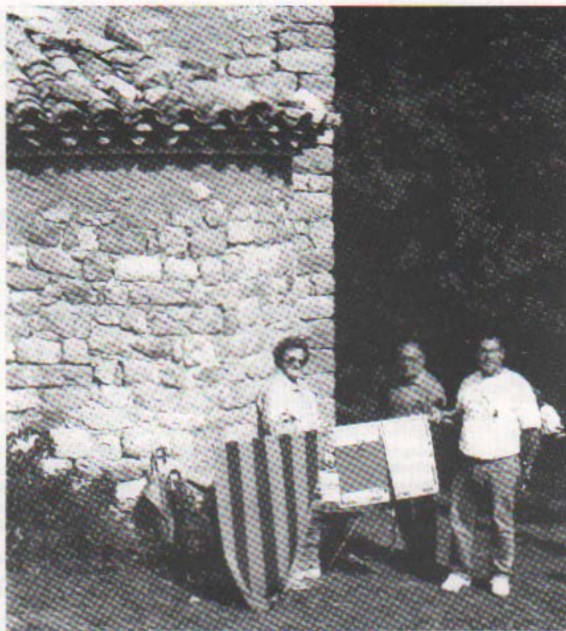
IV Caminada de Guardiola Sant Joan de l'Avellanet