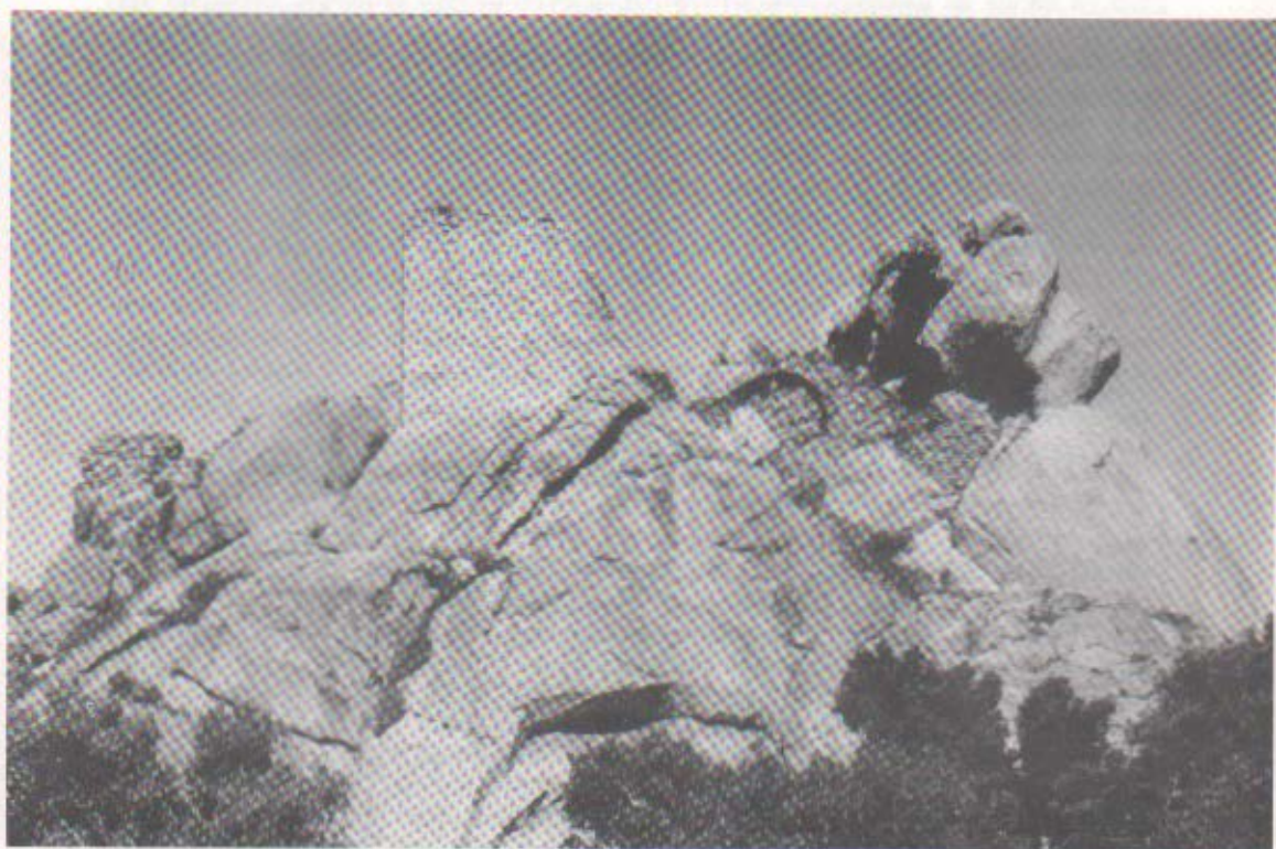
El castell de Rocabertí a la serra de l'Albera. La Jonquera (Alt Empordà)