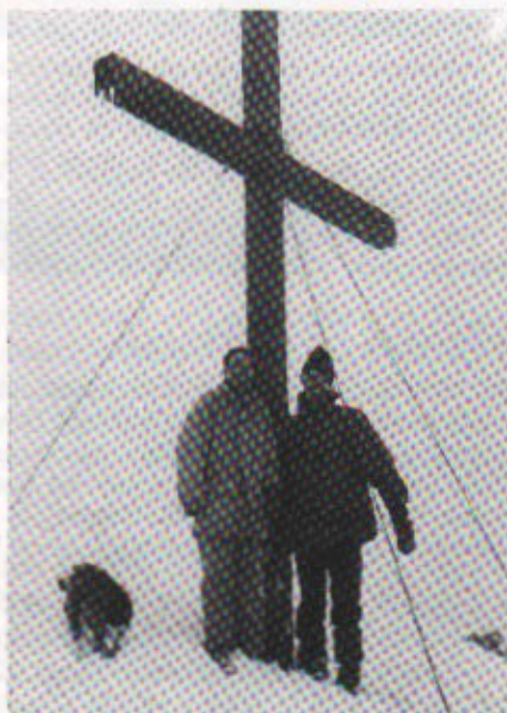
Dalt l'Spitzstein (Àustria)