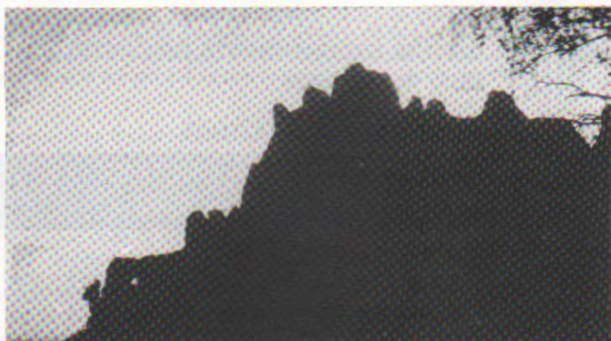
Contrallum de la regió d'Agulles, amb la Cadireta i la Roca Foradada a l'esquerra

De retorn a la cruïlla, continuem endavant i als 5 minuts som a coll de Guirló (800 metres d'alçada): Nus de camins. Transitem en direcció NE, resseguint la falda de la muntanya. Com ja hem apuntat, abans de l'incendi aquest trajecte discorria pel mig de ben formats boscos de pins i alzines. Per a facilitar les tasques d'extinció, el caminet aleshores existent es va eixamplar força, convertint-lo en una autèntica pista fins a les envistes de la Cadireta de les Agulles. En acabar-se, doncs, s'estreny notablement i guanya alçada per accedir al repeu de la roca Foradada (14 minuts)