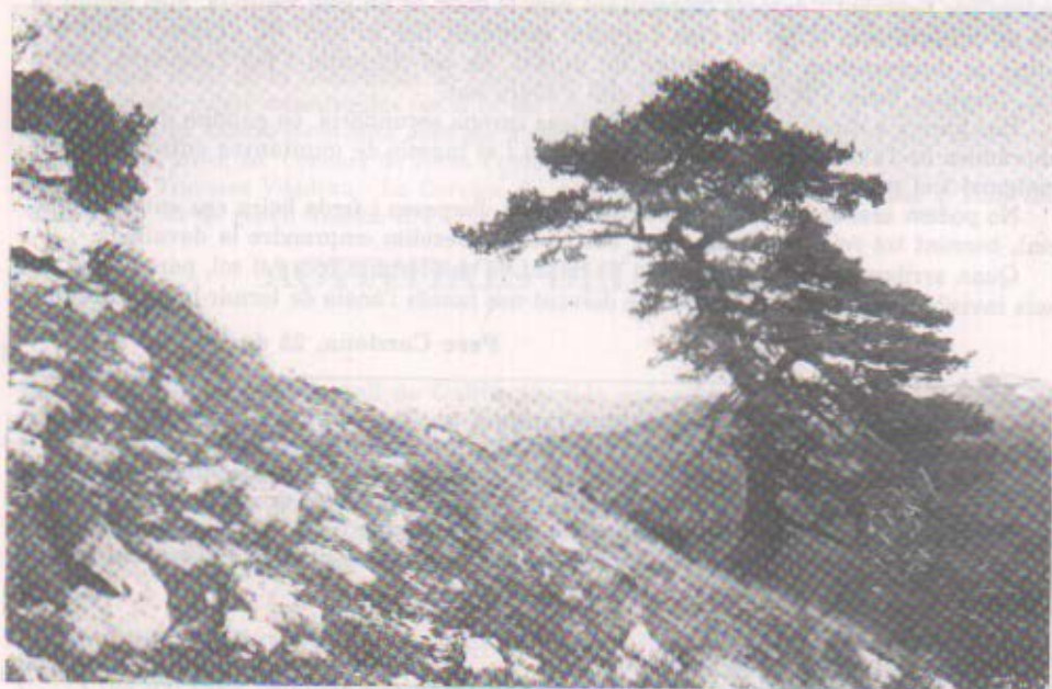
Prop del cim de Bassegoda; al fons, el Pirineu nevat.