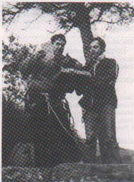
Amb el XXVI Pessebre abans d'iniciar l'escalada a la Castellassa