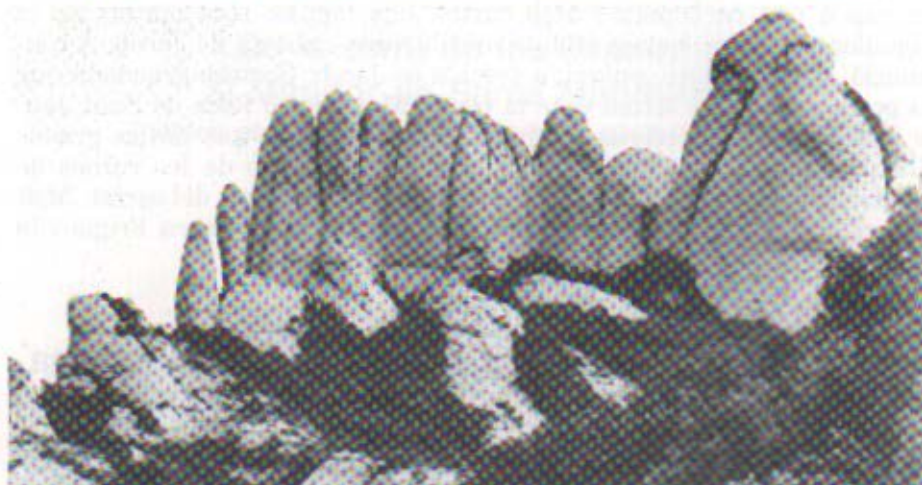
Els Flautats, la Mòmia i roca de Sant Salvador

PROPERA SORTIDA: ELS FLAUTATS I CAMÍ DE L'ARREL