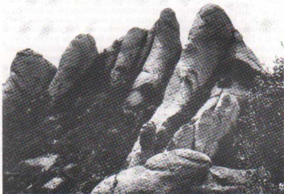
D'esquerra a dreta: Gorra Marinera o Roca de Sant Jaume, Magdalena Inferior, Magdalena Superior i Gorra Frígia (Regió de Tebes)

(per les escales de Jacob, una hora, aproximadament)