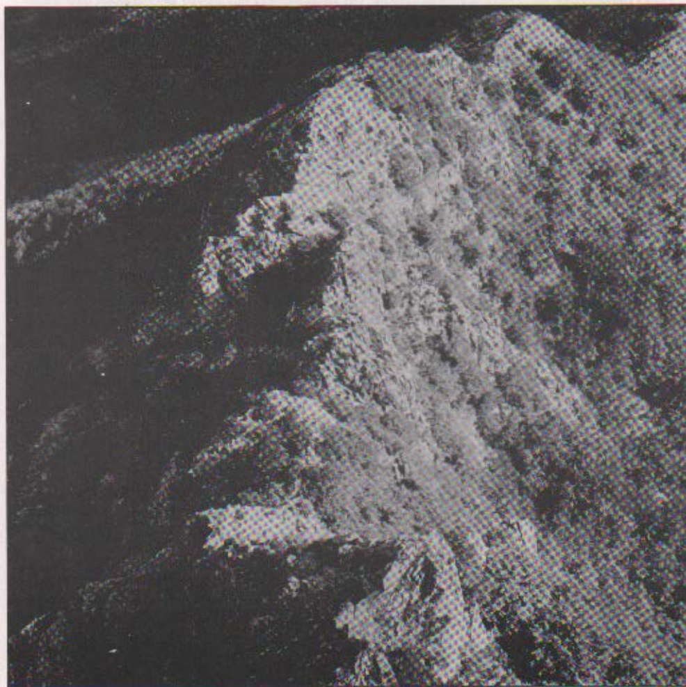
Els Castellets del Montseny.