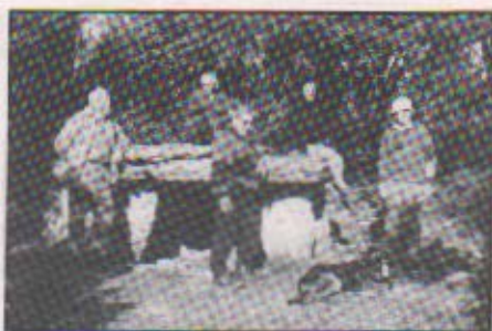
Dolmen de la Costa de can Brui, Osona