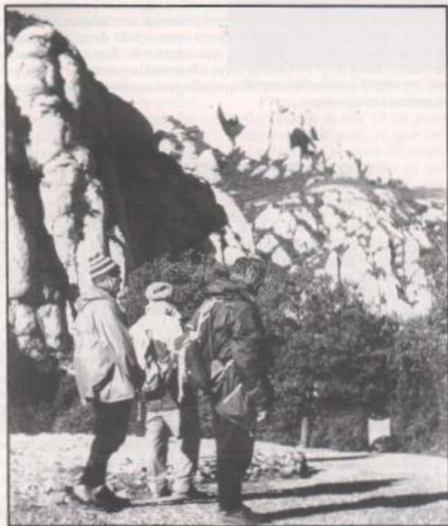
Montserrat, Pla de Sant Miquel (Jaume Torrens)