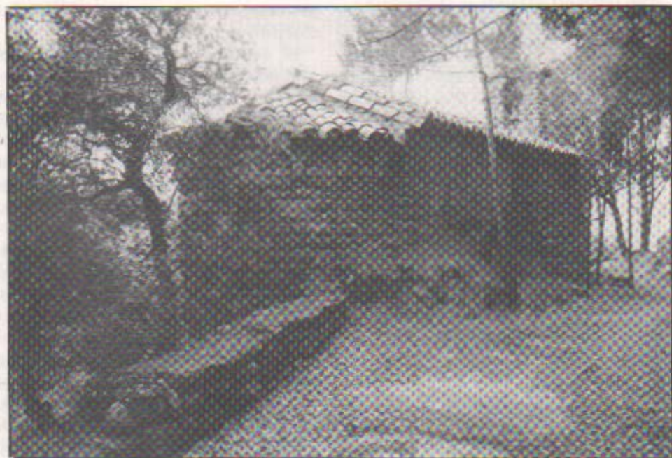
Ermíta romànica reconstruïda de Sant Jaume de Vallverd