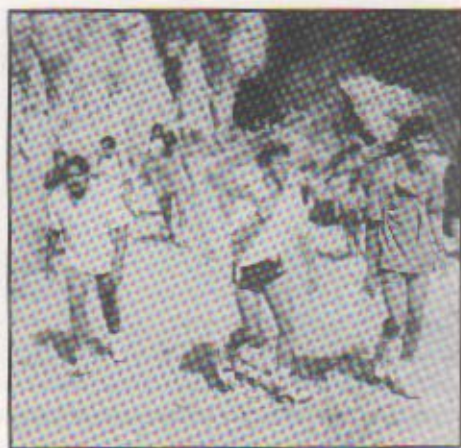
Arribant a Montserrat. Any 1989

Ja ha passat l'onzena travessa de Matagalls a Montserrat. Des de fa 21 anys, aquesta travessa ha anat adquirint importància, fins arribar a ésser una de les més populars de tot Catalunya. Es seu recorregut de 80 km. la converteix en un repte personal on la satisfacció i l'orgull d'aconseguir-ho és la millor recompensa després de tantes hores d'esforços realitzats.