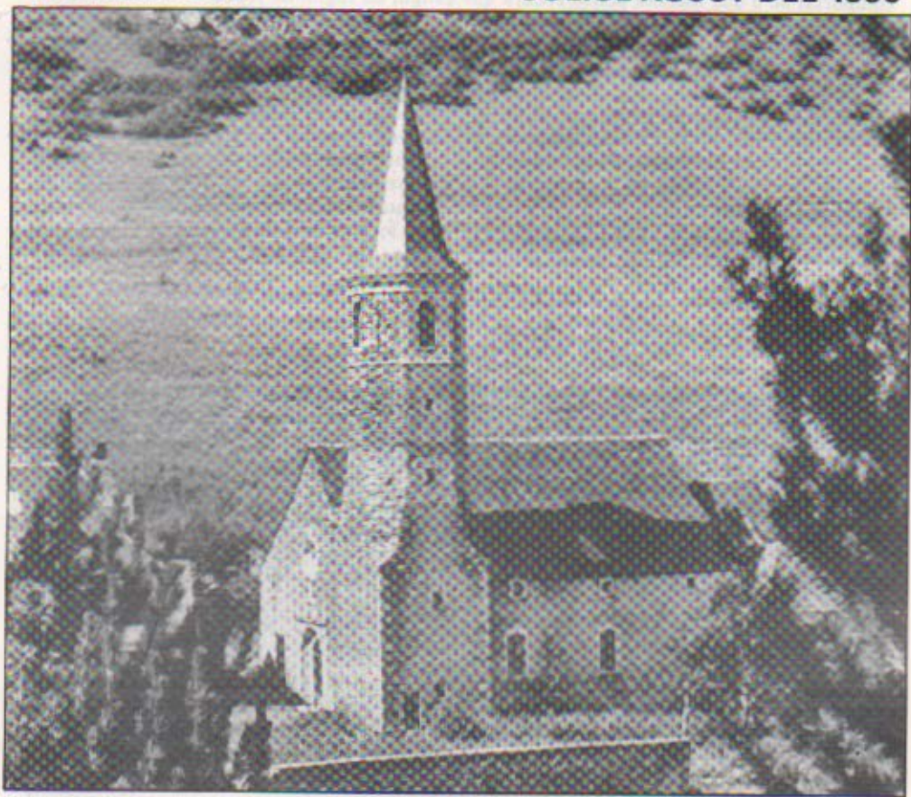
Santuari de Montgarri. Aran